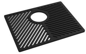
Rejilla Black 8100 652

* sólo en combinación con el accesorio 8644 101