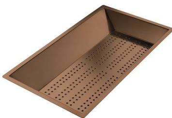
Bandeja perforada inox PVD Copper

* sólo en combinación con el accesorio 8644 101