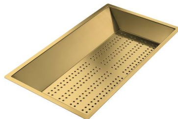
Bandeja perforada inox PVD Gold

* sólo en combinación con el accesorio 8644 101