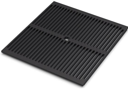
Black grid 8100 617