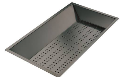
Bandeja perforada inox PVD Gun Metal

* sólo en combinación con el accesorio 8644 101