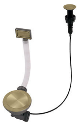
Desagüe automático Space Push Gold